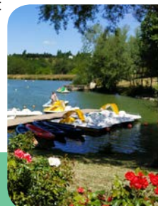
Lac de la Thésauque